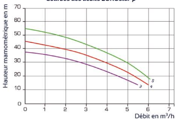
Courbes des débits EUROstar-p

Toutes les parties en contact avec l'eau sont, soit en Noryl (composite) soit en inox 316 L.